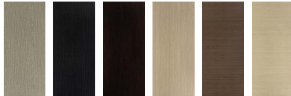
B100 Banjan Blanchi B101 Banjan Noirci C047 Chêne Wengé C098 Chêne de Fil Naturel C101 Chêne Brun Horizontal C102 Chêne Clair Horizontal