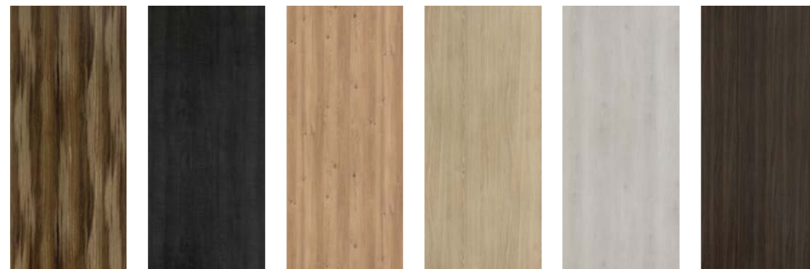
C149 Chêne Colorado C150 Chêne Brasero C179 Chêne des Massifs C180 Chêne Alba C185 Chêne d'Australie C186 Chêne des Combrailles