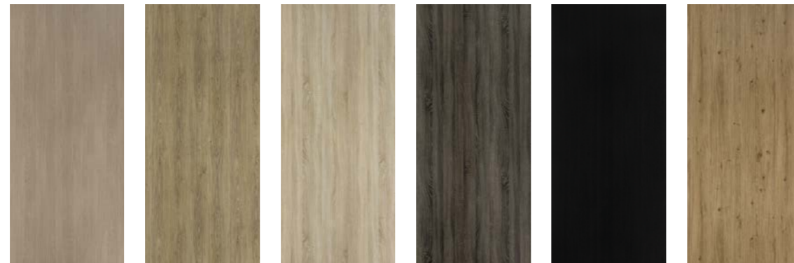
C103 Chêne Lavé C105 Chêne Québec C129 Chêne Bastide C130 Chêne Topia C131 Chêne Murano C133 Chêne Vendôme