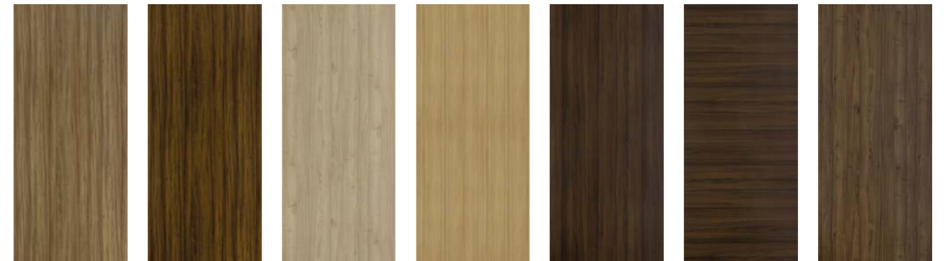
N056 Noisetier Naturel N057 Noisetier Brun N112 Noyer d'Amérique N113 Noyer Marbot N114 Noyer Havana N115 Noyer Havana Horizontal N117 Noyer Chesterfield Horizontal