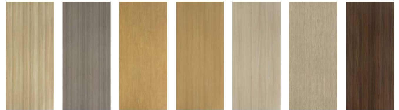
F056 Frêne Scandinave F058 Frêne Cristal H025 Pommier de Honfleur H027 Hêtre de Provence H028 Hêtre Bergen M122 Multiplis Nature N026 Noyer Ombré