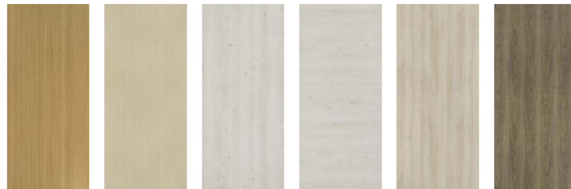
D018 Chêne de Meymac E009 Érable Blanc E103 Érable Féroé E104 Érable Féroé Horizontal E105 Érable Brunswick F012 Fruitiier Cendré