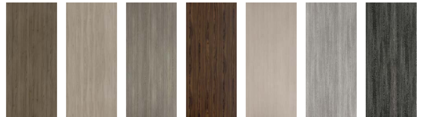
O082 Orme d'Autrefois O110 Orme Brun P118 Pin Argent P136 Palissandre de Santos S040 Cérusé Clair W009 Wengé Blanc Cérusé W017 Wengé Poivre Cérusé